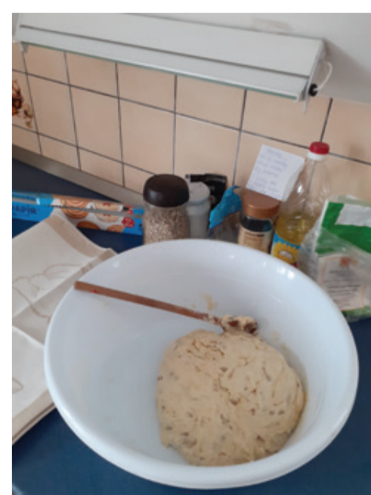
ZKUSILI JSME UPÉČT PEČIVO PODLE TRADIČNÍCH RECEPTUR