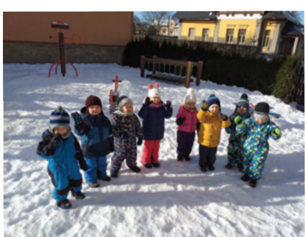
SNĚHOVÉ HRÁTKY V MACEŠCE