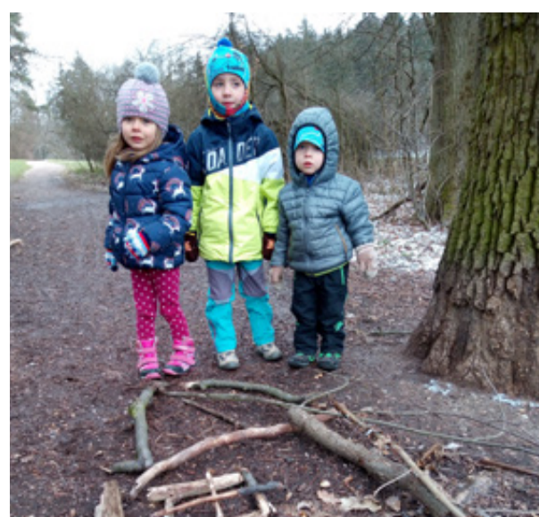
POZDRAV Z PROCHÁZKY ZA VELIKONOČNÍM ZAJÍČKEM