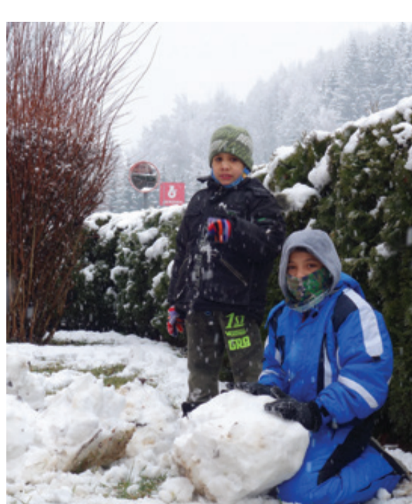
HRY VE SNĚHU NA ZAHRADĚ AZYLOVÉHO DOMU