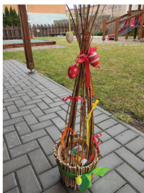
VELIKONOČNÍ DEKORACE DAROVANÁ RODINNÉMU CENTRU