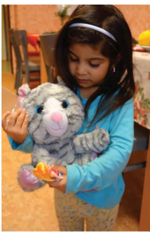
RADOST Z DÁRKŮ